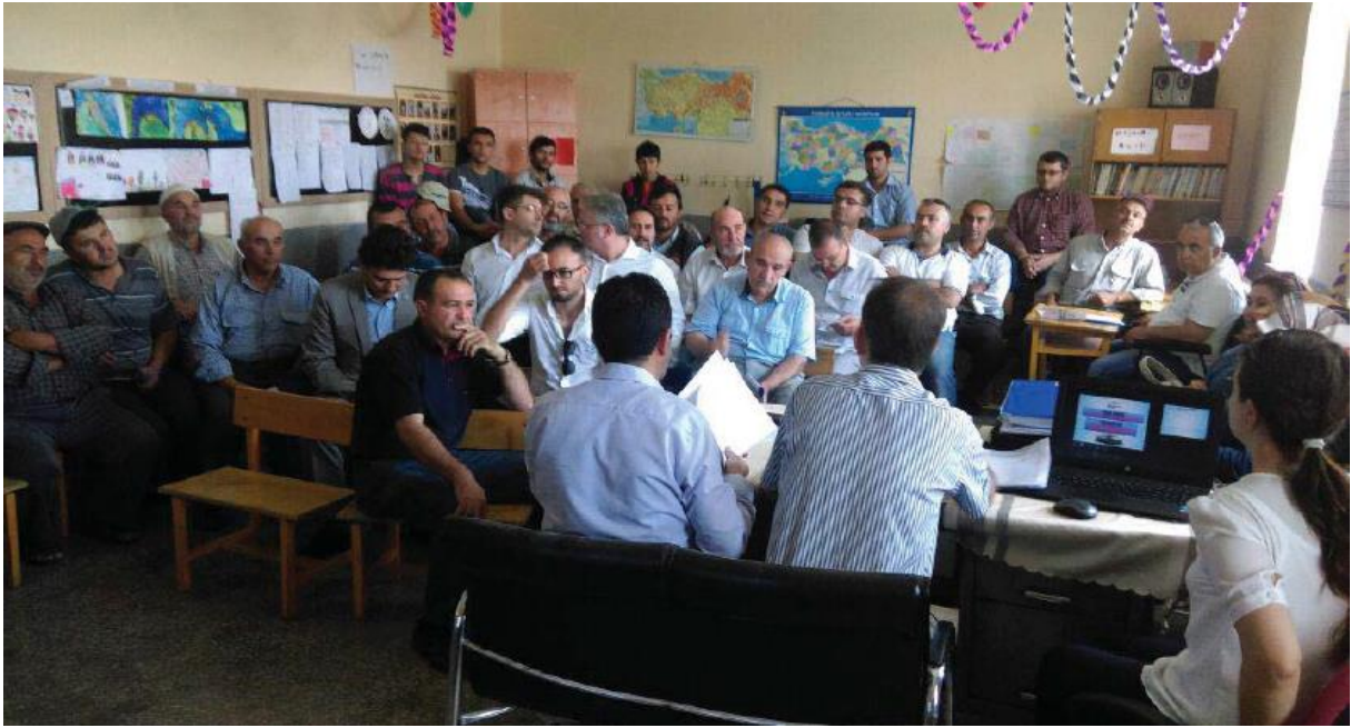
Şekil 5. 30.06.2016 Tarihinde Yapılan Halkın Katılımı Toplantısı Katılımcıları

Buna ilaveten MGS; Boyalı, Boruktolu ve Çomaklı Mahallesi Muhtarları, Meram Belediye Başkan Yardımcısı, Konya İl Tarım ve Orman Müdürlüğü, Meram Kaymakamı ve Meram Ziraat Odası Başkanı ile 2-3 Temmuz 2020 tarihlerinde mahalleye özgü şikâyet ve talepleri değerlendirmek için mülakatlar gerçekleştirmiştir. Bu görüşmeler sırasında yukarıdaki konulara benzer endişeler / öneriler kaydedilmiş ve ilgili fotoğraflar ile Proje'nin ÇSDD Raporunda ayrıntılı olarak belirtilmiştir.