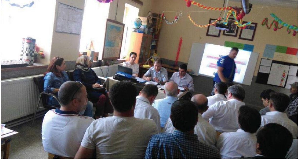
Şekil 4. 30.06.2016 Tarihinde Yapılan Halkın Katılımı Toplantısı