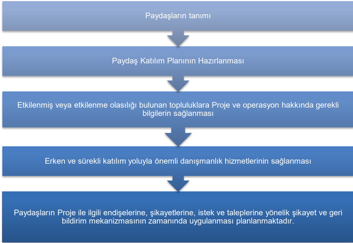
Şekil 3. Paydaş Katılımına İlişkin Uluslararası Standartların ve Yönergelerin Ana Gereklilikleri